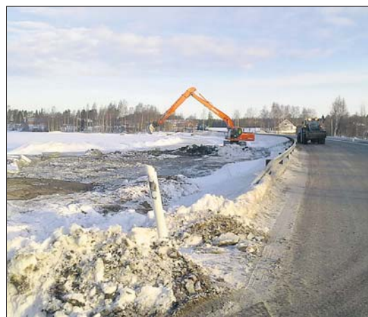
Alajärven Kyrönlahdella on parannettu maaliskuun aikana järveläisiä.

Kun dokuwiki-työskentelyllä kerätty tarinat tallennetaan lopuksi Seutulaariin, säilyvät ne siellä, yhteisessä tarinapankissa, helposti haettavaa ja jäsenlehtiläisissä muodossa. Seutulaariin pääsee tutustumaan Järviseedun Sanomien kotsiivien kautta. – Eri keino Järviseedun-Seuran tallennustössä on keväisin julkaistava Ranskatka-lehti, jota tehdään yhdessä pitäjäläisten ja seudun museoiden kanssa. Tänä vuonna lehdestä on teemana paikallinen ruoka- ja pitoperinne. Lehdessä voidaan kuitenkin julkaista vain rajallinen määrä artikkeleja, mutta toivotavasti se toimii osaltaan herättäjänä paikallisen muistitiedon keruussa.